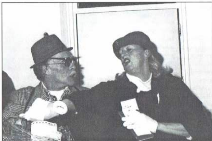
Act van twee 'ervaren' wandelaars ter opluistering van 'Te Voet 5 jaar'