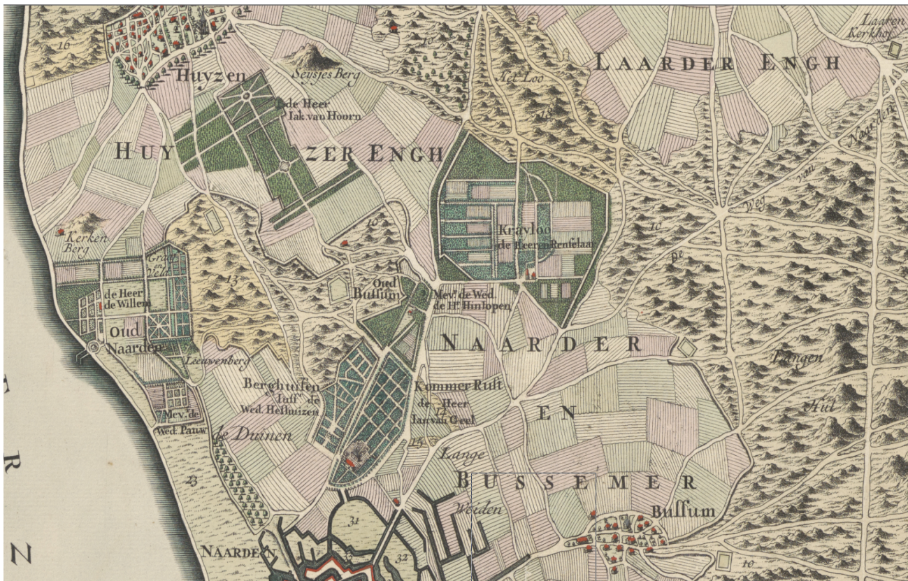
Wandeling landgoederen tussen Bussum, Huizen en Naarden